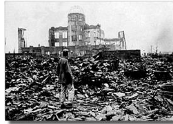
Последице бачене атомске бомбе на Хирошиму у Јапану 1945