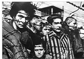
Прогон и убијање Јевреја у немачком логору Аушвиц