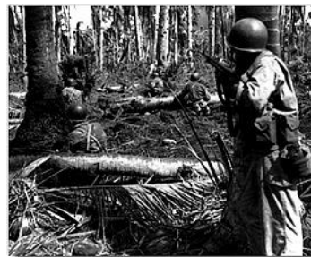
Рат у дунглама на острвима Тихог океана