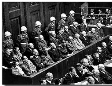
Суђење немачким нацистичким вођама у Нирнбергу 1945.

Подсетите се шта сте научили у теми о друштву и људским правима. Прочитајте основна људска права и размислите која су од њих била прекршена током светског рата.