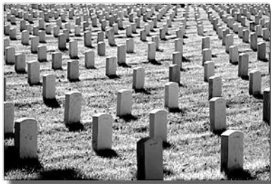
Гробље америчких војника Арлингтон