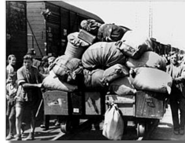
Немачке избеглице после завршетка рата