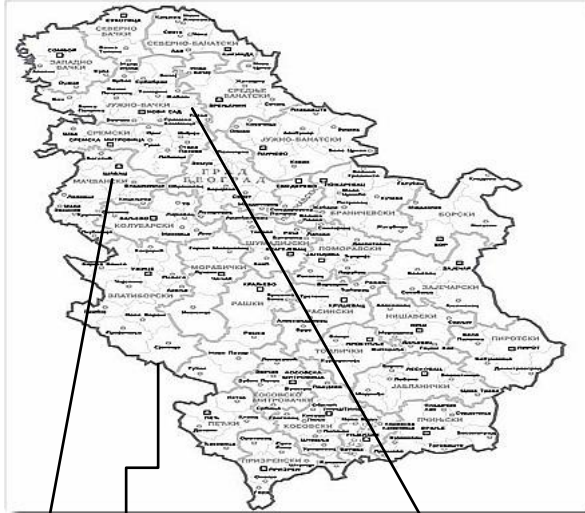
Карта државе Србије