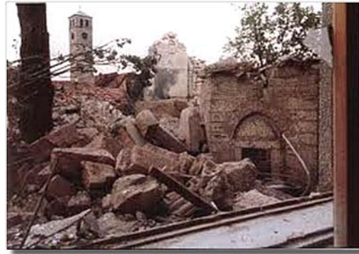
Изглед џамије Ферхадије у Бања Луци, уништене током рата у Босни. Данас, после рата џамија се обнавља.