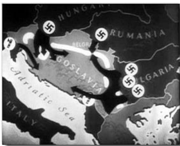
Мапа напада на Краљевину Југославију 1941. године