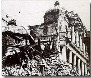
Последице бомбардовања Београда 6. априла 1941. године