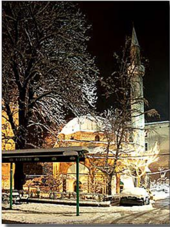
џамија Ферхадија, Бања Лука